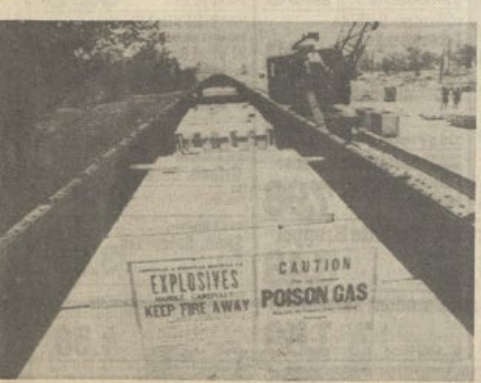
Giftgasraketen, die einseitig gefertigt wurden, liegen auf einem Eisenbahnwagen in Richmond im US-Bundesstaat Virginia.