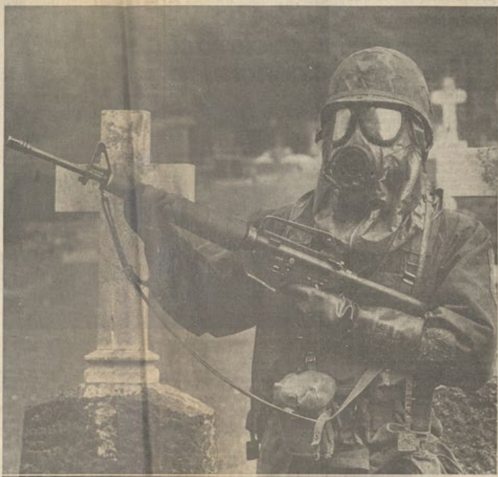
Zwischen Gräbern und Kreuzen wartete ein schutzbergter US-Soldat im Giftschutzanzug nach einem Angriff mit chemischen Waffen während des NATO-Märsches Certain Exposure (Sicheres Gefecht) auf einem oberirdischen Friedhof auf die Entgiftung seiner Panzerlinie. Laut Manöverplan war die Panzertruppe von den aus dem Osten ins Gunggebiet eingedrungenen feindlichen Truppen mit völkerrechtlich verbotenen chemischen Waffen angegriffen worden. Soldaten, Material und Panzer mußten mühsam dekontaminiert angiligt werden.

1. Die Armee der Vereinigten Staaten lagert — wie allgemein bekannt ist — chemische Kampfstoffe in der Bundesrepublik. Diese befinden sich unter amerikanischer Verfügungsgewalt; die Bundesrepublik hat bei ihrem Beitritt zur Westeuropäischen Union ausdrücklich auf die Herstellung von C-Waffen verzichtet und besitzt solche auch nicht. 2. Die Orte, wo die chemischen Kampfstoffe gelagert werden, sind der Bundesregierung bekannt. Auch auf parlamentarische Anfragen hin lehnt sie es jedoch ab, diese Orte namhaft zu machen, da dem „strengen Geheimhaltungsbestimmungen“ entgegensteht.