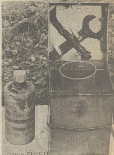
Besonders intensiv wurden Kampfgase während des Zweiten Weltkrieges. Das Giftgas befand sich in Stahlflaschen, die in Metall- oder Holzkräften aufbewahrt wurden.

reicht nicht aus, eine Erfüllung der verfassungsrechtlichen Schutzpflicht darzutun. Die Erfüllung der Pflicht muß, sonst ist effektiver Rechtsschutz nicht möglich, im Rahmen der Gebote praktischer Vernunft auch vom Bundesverfassungsgericht nachgefragt sein. Unspezifizierte Zusicherungen reichen hierzu nicht aus. Dies würde auf eine selbst durch die Erfordernisse der äußeren Sicherheit nicht mehr zu rechtfertigende Privilegierung des militärischen Bereiches hinauslaufen. Im zivilen Bereich ist der Staat bei der Zulassung gefährlicher Anlagen verfassungsrechtlich gehalten, eine Fülle von Sicherheitsvorkehrungen zu verlangen und sich im Detail dem betroffenen Bürger gegenüber vor Gericht deswegen zu verantworten. Dafür, daß dieser intensive Rechenschaftspflicht des Staates im zivilen Bereich eine totale Rechenschaftsfreiheit im militärischen Bereich gegenüberstehen dürfte, bietet das Grundgesetz keinen Anhalt. Insbesondere muß wenigstens von der Bundesregierung dargelegt werden, daß und gegebenenfalls welche den Erfordernissen der praktischen Vernunft genügende Sicherheitsmaßnahmen überhaupt getroffen werden können, die eine Alternative zu der Maßnahme bilden, die das